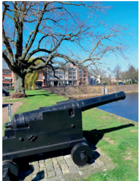
Kanon met op de verre achtergrond de treurwilg

Zo werden de voorouders van Sinti en Roma voortgestuwd door veroveringstochten van Arabieren en oprukkende Turken (Seltsjoeken) en kwamen zo ook in contact met de legers van de kruisvaarders.