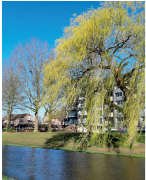
De treurwilg is duidelijk anders dan de andere bomen speciaal in het vroege voorjaar

De gelijkwaardigheid in het gesprek is zoek. Dat wil zeggen er geen respect voor ons is en geen begrip voor de omstandigheid waarin wij verkeren. Het gesprek verloopt slecht omdat de ambtenaar helemaal geen vertrouwen in ons uitstraalt. We leggen dan heel gemakkelijk een verband met wat ons vroeger al is overkomen. Het verhaal gaat dat Hitler ooit heeft gezegd over zigeuners: "Van de mest op de grond komt meer terecht