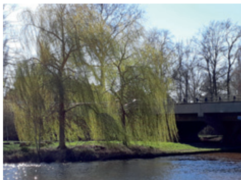
De treurwilg langs de brug die de stad verbind met het platteland

één groep, er in India en Pakistan uitgezien heeft, is nergens meer te achterhalen. Er zijn wetenschappers die beweren dat de eigen woordenschat van Sinti en Roma meer verwijst naar een stedelijke oorsprong. We kunnen hooguit wat van hun voorgeschiedenis vermoeden. Mondelinge overlevering helpt ons niet veel verder en wat er te vinden is in de Perzische literatuur is te schaars, bovendien te vaag en te onzeker. Soms houdt men hen voor op de vlucht geslagen krijgers, in een andere verhaal zijn ze misschien Indische muzikanten die door een Perzische sjah gevraagd zijn voor vermaak in zijn land.