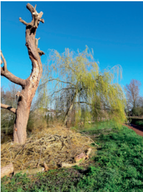
Afgesnoeide takken van de treurwilg vergaan aan de voet van de oude uitgeleefde en beschadigde stam

In Europa lopen de eerste sporen van hun aanwezigheid over Griekenland.