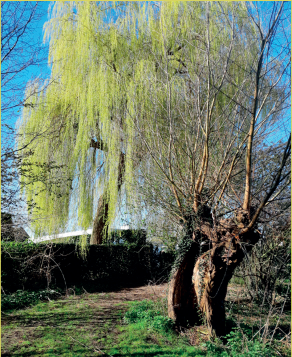
Treurwilg met op de voorgrond een oude knotwilg