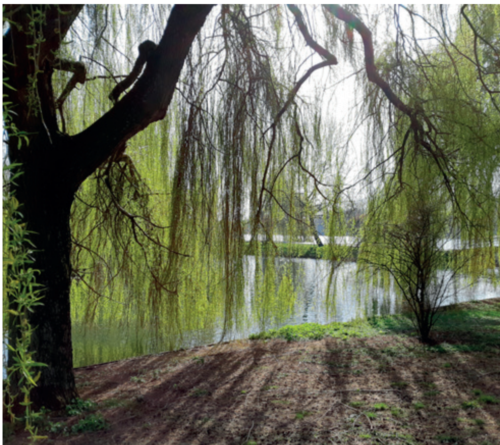
In de schaduw van de treurwilg

uit. Er viel in het begin, na 1945, voor hen weinig op te bouwen en deel te nemen en er was geen vast huis vanwaar uit gewerkt kon worden. De horror van de oorlog had hen verlamd en vaak dakloos gemaakt. Die verlamming werkte door in de verschillende daaropvolgende generaties. Hun overgrootvader en verschillende familieleden waren op transport gesteld en vermoord tijdens de oorlog. Grootvader had, wonder boven wonder en met angst en beven, de oorlog overleefd. Hij bleef zitten met de vragen over wat er met zijn familie was gebeurd. Hij had bijna niets meer om op terug te vallen. Dat was zijn startpunt. Hij kon nu niets anders doen dan ventend rond te trekken om aan de kost te komen.