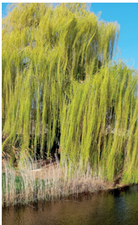
De waardigheid van de treurwilg

Dat betekent dat de jongeren deze generatie van boven de vijftig van dienst zijn. Zij hebben veel gedaan voor de jonge generatie nu dient de jongere generatie voor hen te zorgen. Het is ook wederkerig. De vijftigers kunnen zich nu ook meer vrij maken voor de jonge gezinnen zodat de jonge ouders kunnen gaan werken.