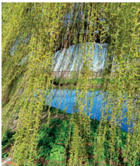
Een oude treurwilg met nog frisse buigzame takken. Op de achtergrond de stad

Dan slaat het coronavirus toe en de winkel moet voor onbepaalde tijd dicht, terwijl de kosten van de huur moeten worden doorbetaald.