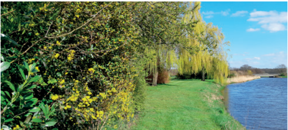
Op het platte land in de vroege lente bloeien de mahoniestruik en de forsythia met de treurwilg op de achtergrond

Wie men ook is, ieder weet van zichzelf heel goed bij welke Roma-groep hij of