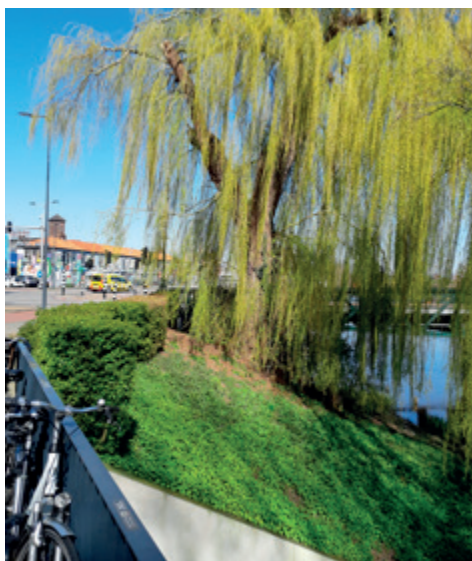
De treurwilg langs het water in de stad. Op de hoek van een drukke kruising van wegen en bruggen.

krijgen. Een maatschappelijke werker van de gemeente zou voor ons op zoek gaan naar een huurwoning. Zoals we hebben gehoord is zij er niet in geslaagd om ons bij de woningbouwvereniging in te laten schrijven. In een vergadering met ambtenaren van de gemeente, maatschappelijk werk en "veilig thuis" is gezegd dat het moeilijk was ons te herhuisvesten. Een ambtenaar zei toen dat we dan maar weer terug naar de caravan moesten gaan. Waarop mijn vrouw met verbazing reageerde. Het bleek toen een flauwe grap van die ambtenaar te zijn.