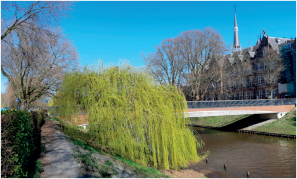
Voormalig klooster op de achtergrond