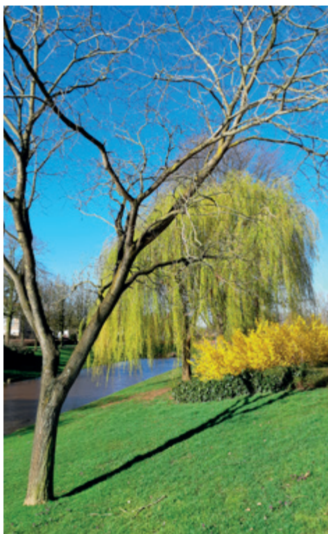
Samenspel van de natuur

Twee jaar geleden kreeg ik een baan op een kledingfabriek. Hier werkten mensen van alle nationaliteiten. Dus daar viel ik