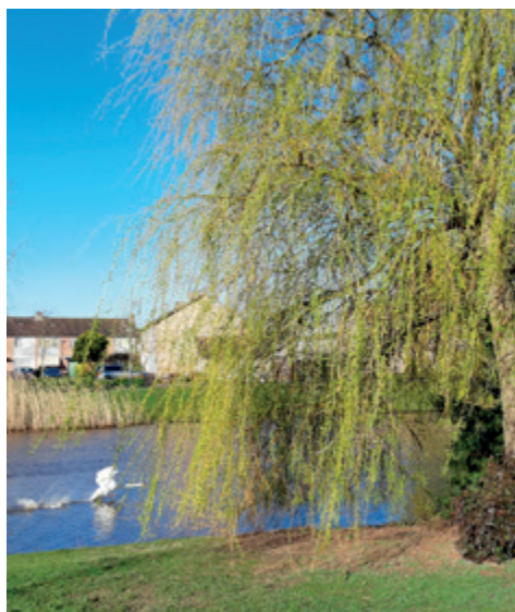
Een zwaan wordt opgejaagd door een gans vlakbij een treurwilg

De achterdocht is de laatste jaren alleen maar toegenomen. Toen wij jaren geleden uit het huis werden gezet vanwege huurschuld, vonden we dat deze huisuitzetting een poging van de jeugdzorg was om onze kinderen af te nemen. De huisuitzetting was zeer heftig. Juist in die tijd dat de jeugdzorg wekelijks op bezoek kwam en enkele kinderen onder toezicht stonden. Als we door deze uitzetting dakloos zouden zijn geworden