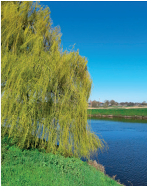
De treurwilg groeit op zijn best langs de waterkant

Er zit ook een talent in mij anderen te helpen om te sporten zoals we nu doen binnen onze stichting. Samen met twee andere Sinti hebben we een jaar zaalvoetbal voor jongeren met succes afgesloten. We zijn aan het tweede jaar begonnen en tegelijk hebben we een nieuw project opgestart voor kinderen van acht tot twaalf jaar. Mijn ambitie ligt in de sportwereld en zeker de sportwereld waar onze kinderen en jongeren verder worden geholpen.