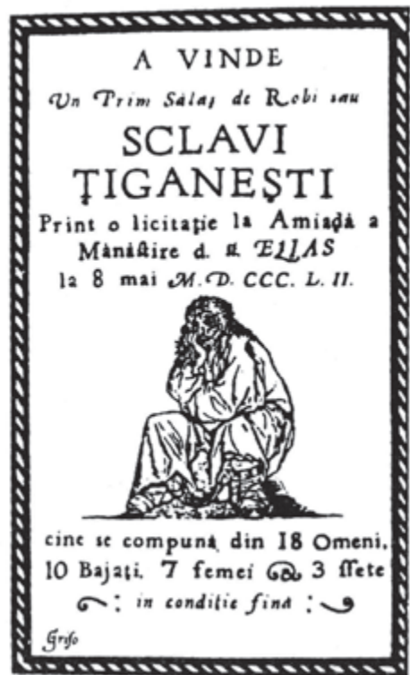
Daar vinden grondbezitters (bojaren) het heel gewoon om Roma als slaven ('robi') te kopen en te verkopen

In de "Weltchronik der Zigeuner, deel I" van Reimar Gilsenbach (pagina 271) wordt daar nog iets aan toegevoegd: "Met de Reformatie droogt in de protestantse landen de pelgrimsstroom op. ... men stelt niet meer dat je God welgeval- lig bent als je een pelgrimstocht maakt... alleen het principe 'bid en werk' geldt nog... en 'werken' wordt vooral opgevat als plicht van het volk. Evenals anderen die rondtrekken hebben ook zigeuners nu geen kans meer om als pelgrim overal goed ontvangen te worden. Erger nog, veel zaken die Sinti en Roma van ouds deden zoals waarzeggen, genezings- praktijken, musiceren en allerlei soorten openbare optredens worden nu niet meer beschouwd als werk." Niet alleen in het westen werden de Sinti op den duur niet goed bejegend, zo ook de Roma in Oost Europa. In Roemenië het meest. Daar vinden grondbezitters (bojaren) het heel gewoon om Roma als slaven ('robi') te kopen en te verkopen.