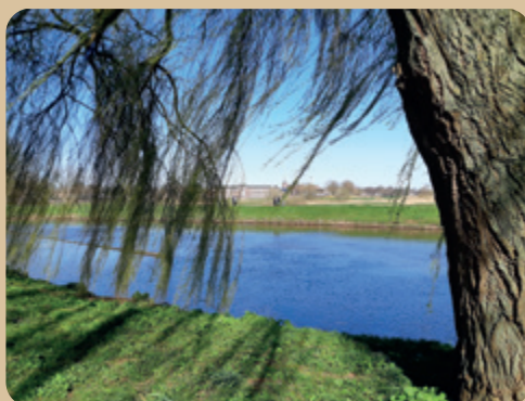
Zondag 22 maart 2020 de eerste 'stille' zondag in Nederland tijdens de corona pandemie

In elke eerdere uitgave van deze levenswerkboekjes is dit onderwerp aan de orde geweest. Nu is er een extra uitgave aan gewijd. Hoe kwam dit boekje tot stand? Interviews vonden plaats met degene van de leeftijdsgroep die geen werk heeft. De gesprekken werden opgetekend en samen herlezen. Tegelijk met het uitwerken van het verhaal werd gezocht naar een uitweg van de werkloosheid. Samen zetten we een plan op om de weg naar werk in te zetten. In dit deeltje delen we de verhalen met drie langdurige werklozen en een familiegroep met een uitkeringen en schulden. Ervaringen van de eerste stappen naar werk worden beschreven.