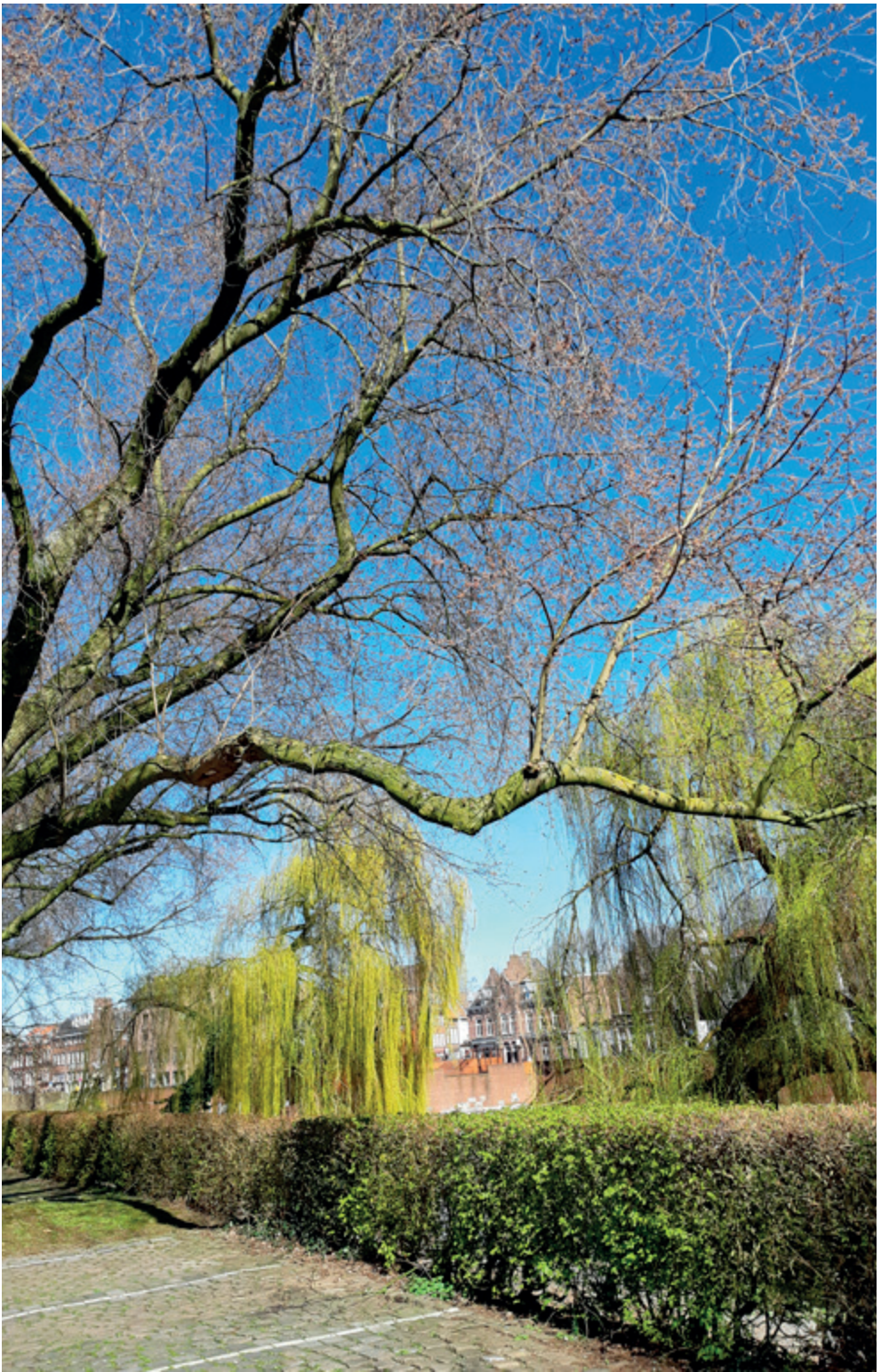
De treurwilg aan het begin van de lente van het jaar 2020: goudkleurig, buigzaam, soepel en waardig