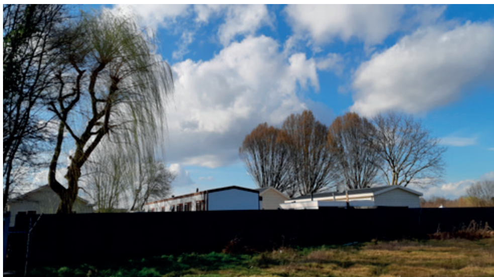
Toen gezamenlijk op reis om de kost te verdienen, nu op elkaar aangewezen op een vaste plek

De meesters en juffrouwen waren Nederlanders en spraken onze taal niet. Er was weinig uitwisseling met de burgerscholen in het dorp. Na mijn dertiende jaar ben ik niet meer naar school gegaan en ben ik al met mijn vader en moeder meegegaan om het slijpers vak uit te oefenen. Sommige kinderen bleven langer op school. De meisjes kregen kook- en naailes en de jongens een beetje timmeren en zo. Er werd niet echt gedacht aan een voortgezet onderwijs of een vak leren. De meeste kinderen gingen van school af; de jongens om vader te helpen en de meisjes moeder. Als men aan je vroeg wat je later ging doen dan zeiden de meesten: venten.