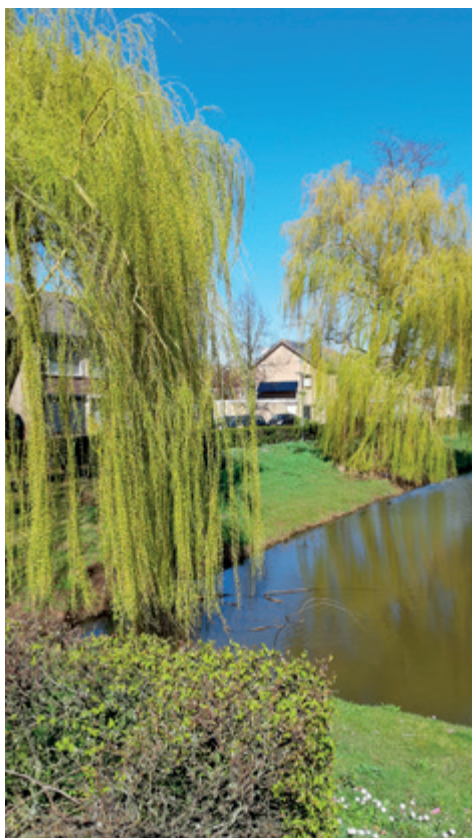
De treurwilgen sieren de wijk

Trouwens in de voormalige Oostbloklanden wonen Roma over het algemeen al lang in huizen, zelfs de familiegroepen die traditioneel rondzwierven, omdat het permanent rondtrekken niet meer geoorloofd is.