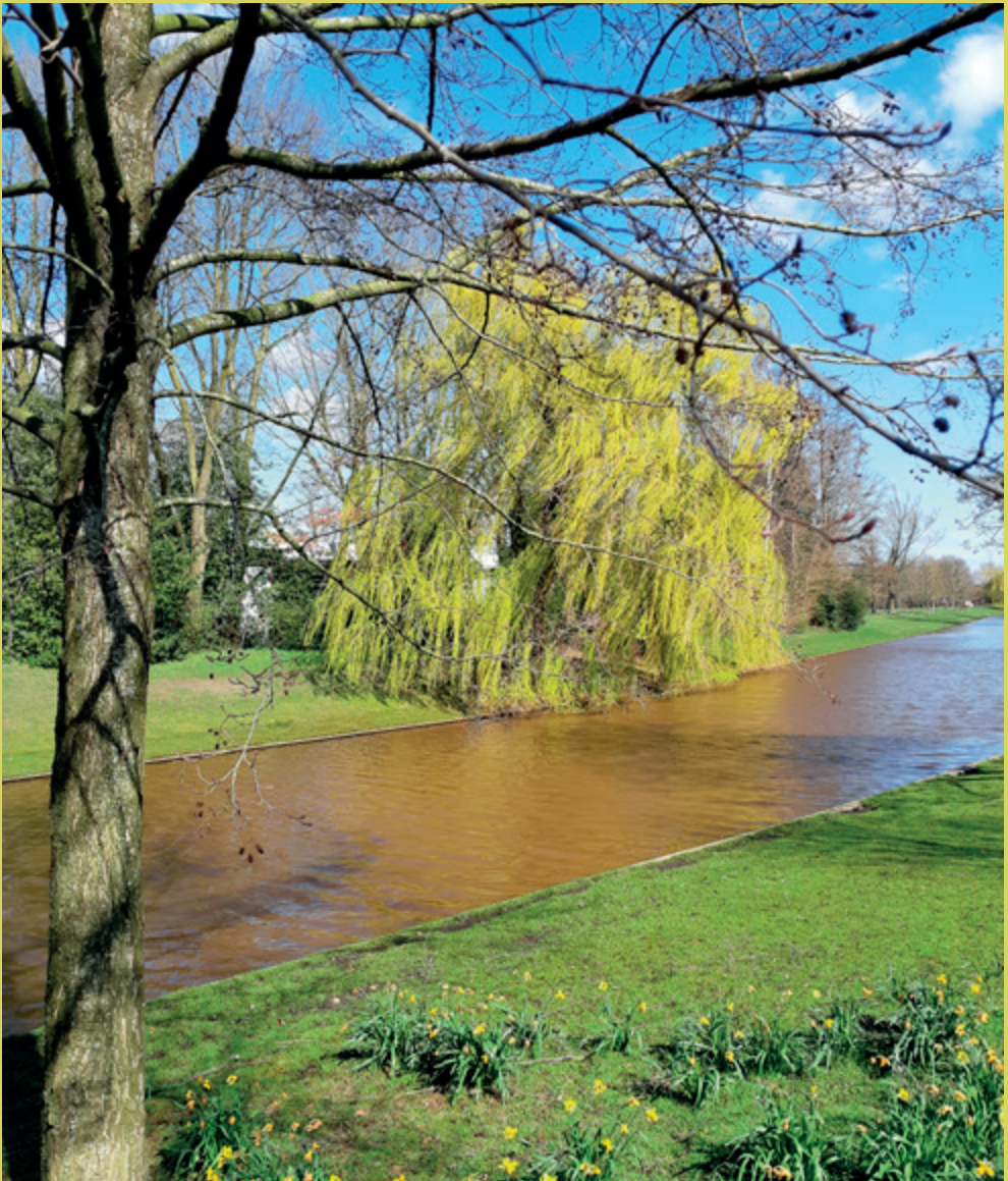
De treurwilg kondigt het nieuwe jaargetijde aan