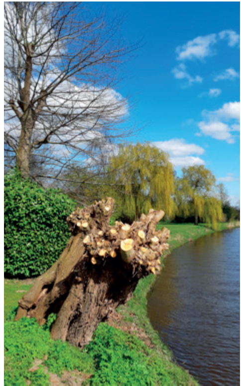
De verschillende groei en bloeiwijze van de natuur in het voorjaar

Dit levenswerkboekje wil een stimulant zijn om de werkgelegenheid onder Sinti en Roma te verbeteren. En in het bijzonder dat de vierde en vijfde generatie vanaf de oorlog, de twintigers en de dertigers, ten volle gestimuleerd worden om deel te nemen aan het leven op alle fronten van onze samenleving. Laat de lokale gemeenten, de burgerbevolking, het onderwijs, de ondernemers, de