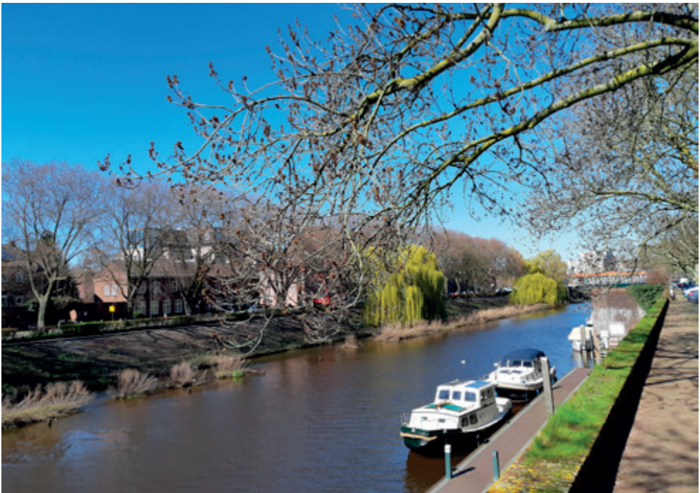
De treurwilg geeft kleur in de vroege lente

Op hun tocht langs de steden toonden ze beschermingsbrieven van kerkelijke en wereldlijke gezagsdragers. Daarmee trokken ze vrij rond en werden gastvrij ontvangen. Verhalen over hun afkomst en waarom ze rond moesten trekken, werden aanvankelijk gretig geloofd. We lezen in 'Herfsttij der Middeleeuwen' van Huizinga: "De Parijzenaars kwamen in grote menigte naar het vreemde volkje kijken en lieten zich de hand lezen door de vrouwen, die de lieden het geld door toverkunst of op andere wijze uit de beurzen