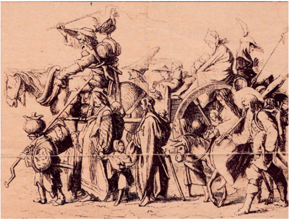
Zwervende handwerkers en kooplieden op reis