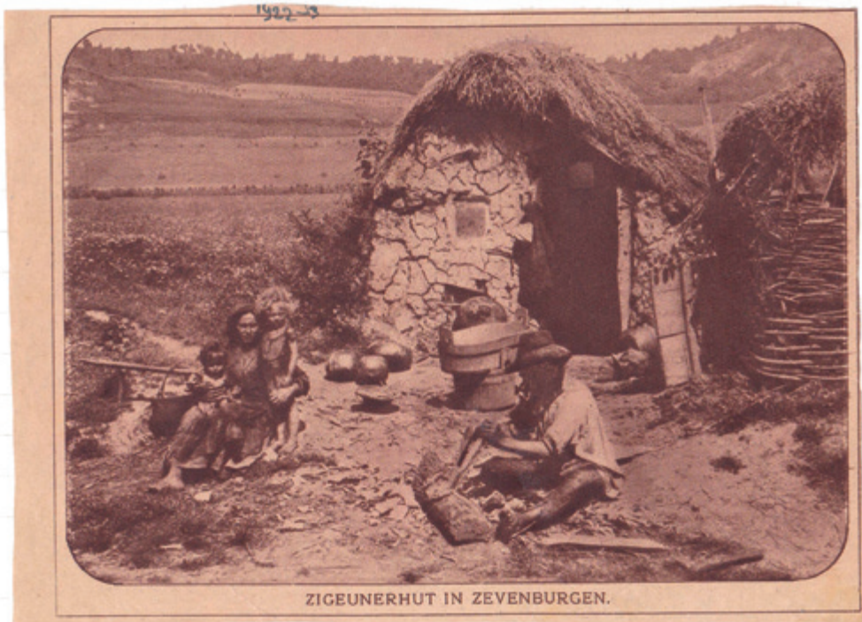
Primitieve behuizing (rond 1920) van een Romafamilie in Zevenburgen Hongarije. Tegenwoordig hoort deze landstreek bij Roemenië en heet Transsylvanië of Ardeal

paardenhandelaars), de Ursari (Roemeens: berenleiders), de Muzikanti/Lautari (Roemeens: muzikanten en instrumentenmakers) of zij die genoemd zijn naar een opmerkelijk handwerkproduct.