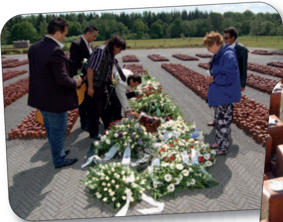
< Herdenking van het transport dat op 19 mei 1944 uit kamp Westerbork vertrok.